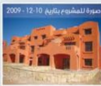
صورة للمشروع بتاريخ 10-12-2009