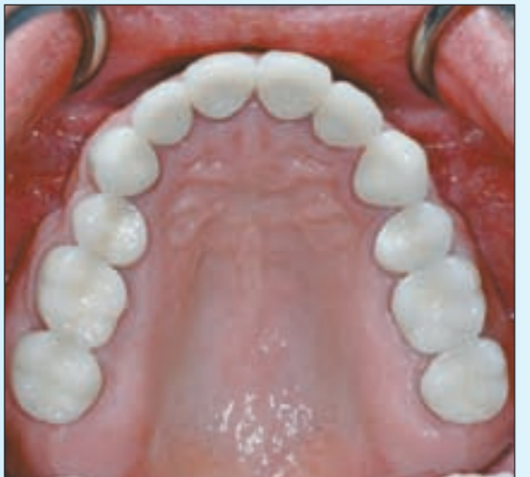
بعد تركيب التاج

فعلى مريض القلب تنظيف أسنانه بالفرشاة والمعجون مع الخيط السني بعد كل وجبة طعام وذلك بطريقة سليمة، وأن يراجع طبيب الأسنان بشكل دوري كل 3 أشهر على