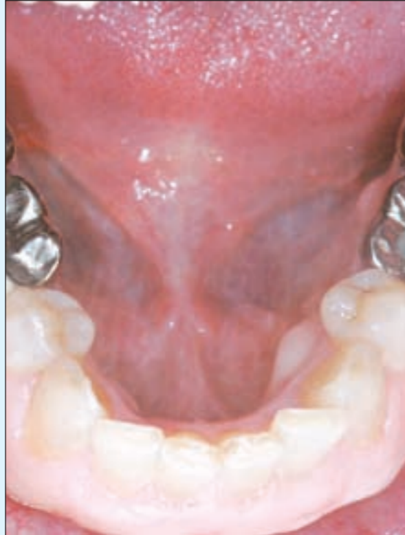
الفك السفلي قبل تركيب التاج