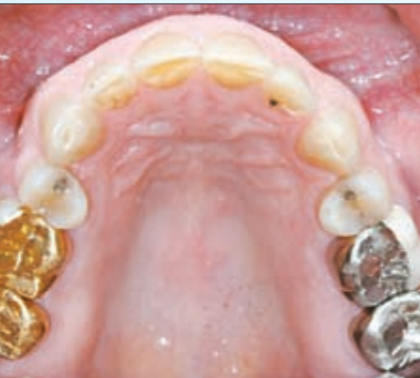
الفك العلوي قبل التركيب