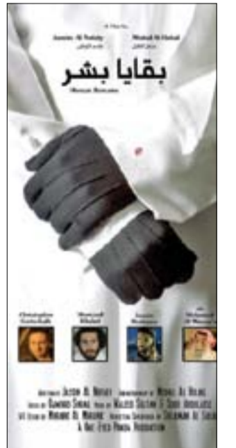
بوستر «بقايا بشر»

ويعرض فيلم «الجعدة» للمخرج الكويتي داوود شعليل قصة عائلة كويتية يخوض اصغر أبنائها حرباً لتقطع أخباره عنهم؛ بينما يحتفي فيلم «أي جندي» للمخرج مساعد المطيري بمفهوم الصداقة الحقيقية، عندما يقرر جندي مخالفة أوامر رؤسائه عادماً إلى