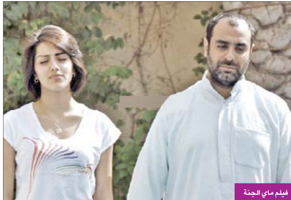
فيلم ماي الجنة

أرض المعركة لسحب جثة صديقه. ويستعرض «عطسة» للمخرج مقداد الكوت، وهو فيلم قصير يستثير العواطف في قالب كوميدي فكاهي، قصة «علي» الذي يعطس عن غير قصد في وجه أحد مديريه لينتابه قلق عارم حيال التغيير الذي سيطرأ على حياته بعد هذه الحادثة.