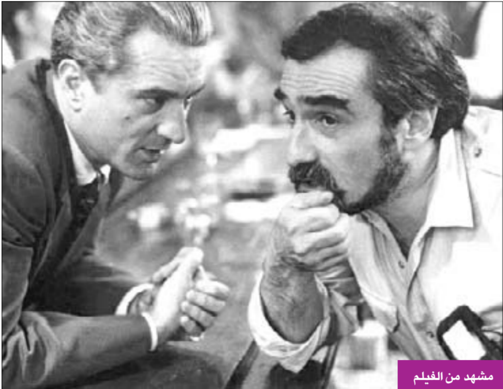
مشهد من الفيلم

ضمن نشاطات ديوانية الأفلام، يعرض نادي الكويت للسينما غداً فيلم «غود فيلاس» أو «رفاق طيبون»، الساعة السابعة والنصف مساءً، بمقر النادي بالمدرسة القبلية، والفيلم من بطولة روبرت دي نيرو وراي لونا وجوبيسكي ومن تأليف وإخراج مارتن سكورسيزي، ومن إنتاج عام 1990.